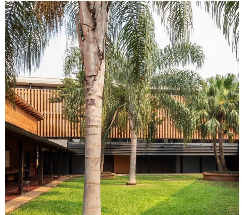
Școala ASA Steam, arh. Equipo de arquitectura, Asunción, Paraguay, 2020