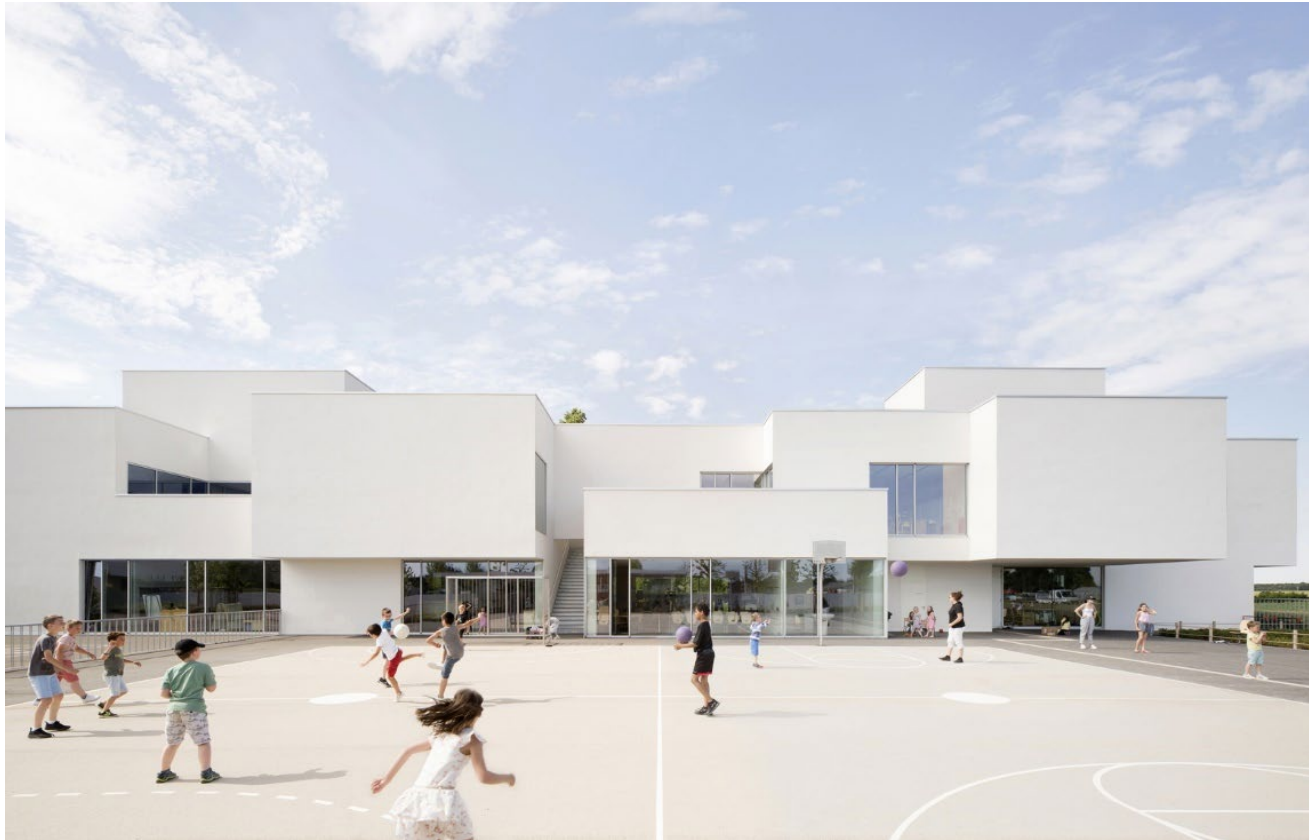
Școala Olympe de Gouges, arh. Dominique Coulon & Associés, Franța, 2019

Cum influențează prezența vegetației sonoritatea spațiilor exterioare?