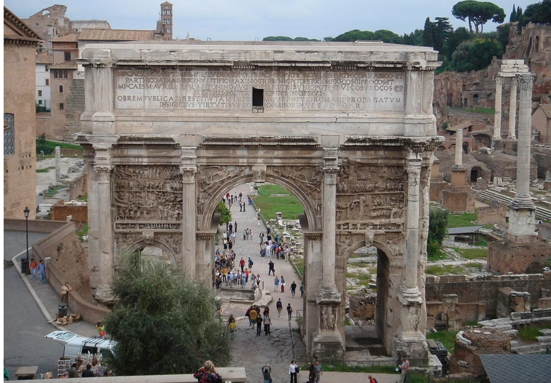
Arcul lui Septimius Sever, Forumul Roman, Roma, Italia

Scara monumentală, făcută să impresioneze oamenii, semnifică puterea celui care l-a construit.