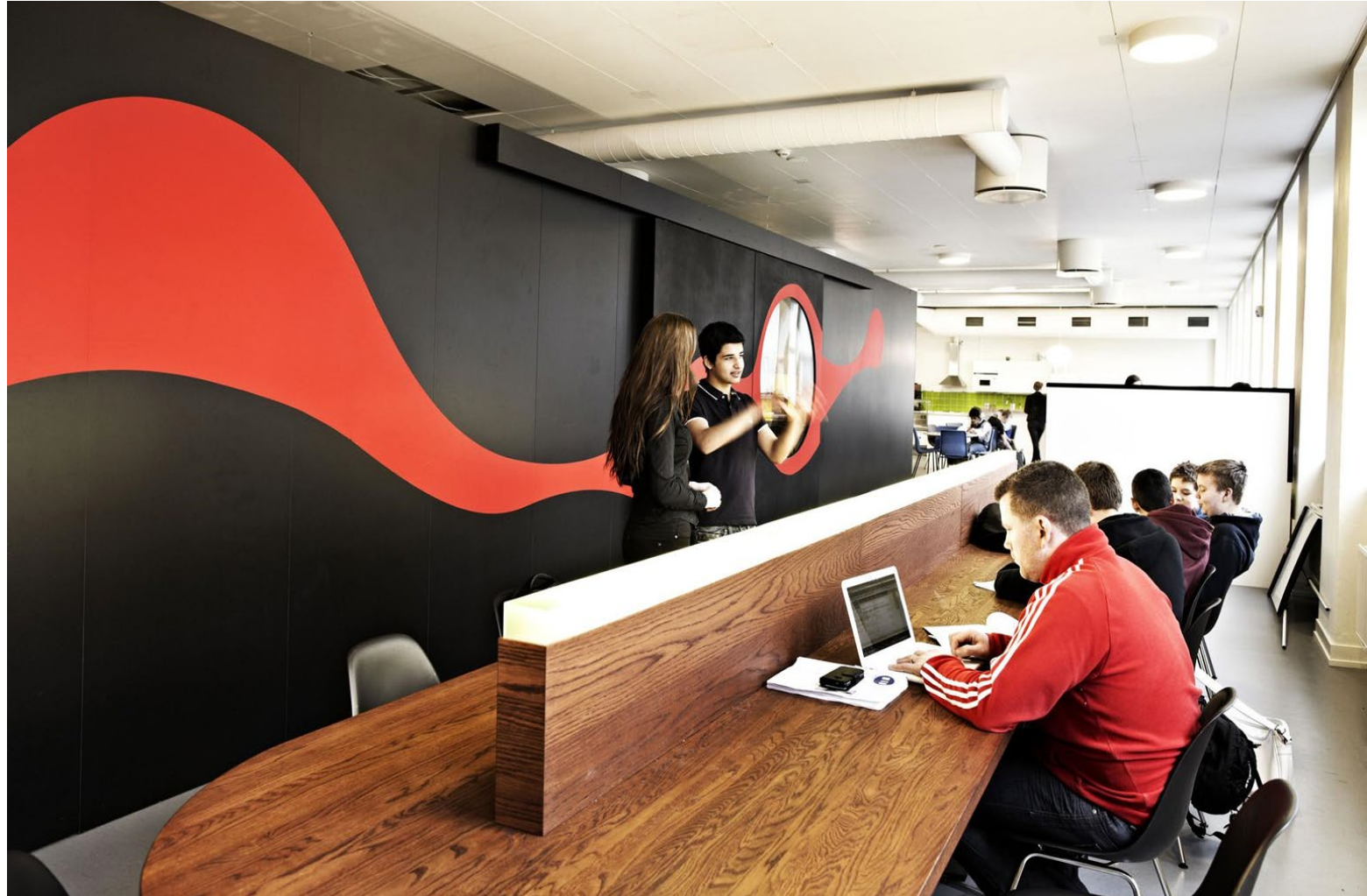
Școala Vittra, Södermalm, Rosan Bosch_Suedia, 2012