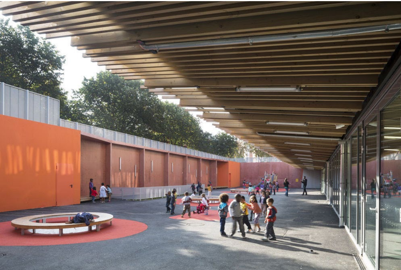
Școala Françoise Dorleac, arh. DE-SO, Paris, Franța, 2014

Copiii mici au nevoie de spații adaptate la dimensiunile lor.