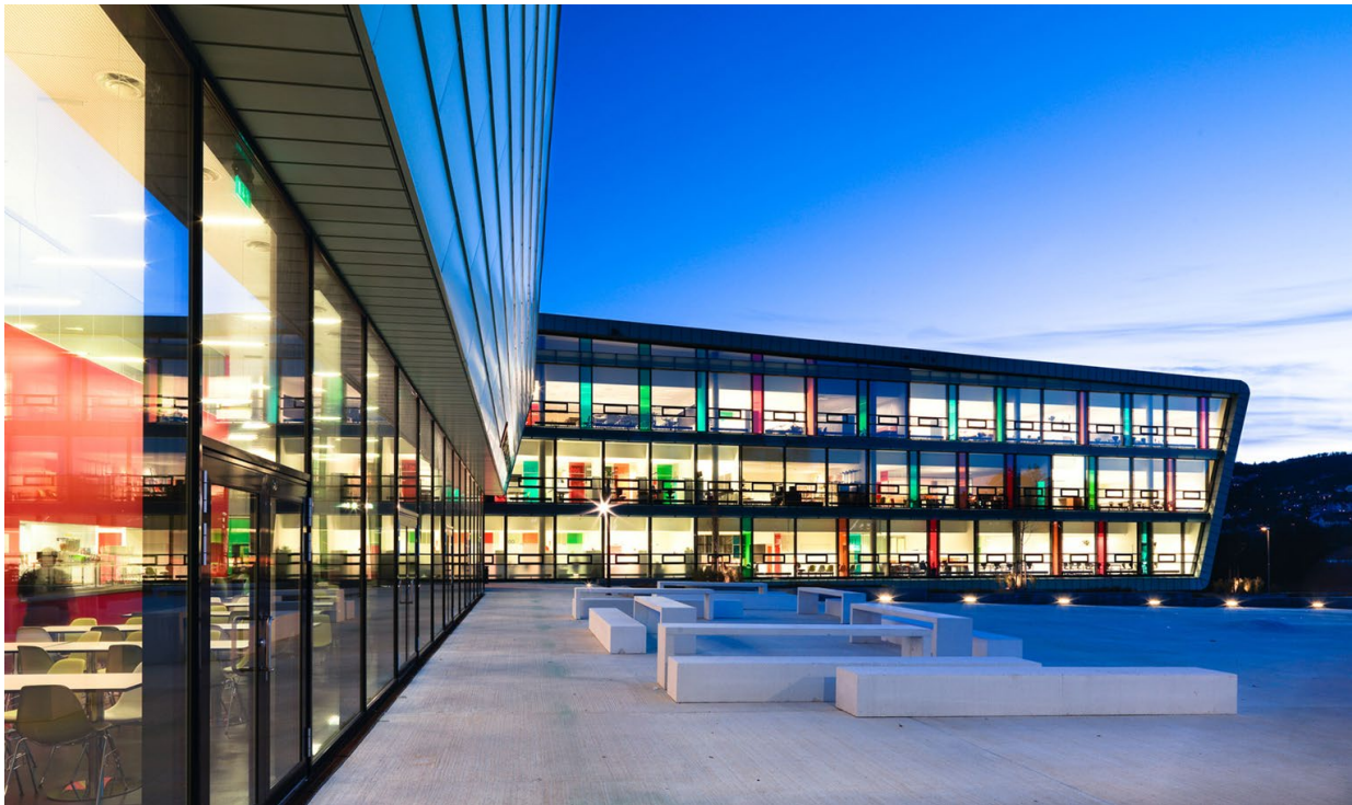
Liceul Nordahl Grieg, LINK arkitektur, Norvegia, 2010

Accesul direct către elemente naturale oferă minții și corpului relaxare și înprospătare,