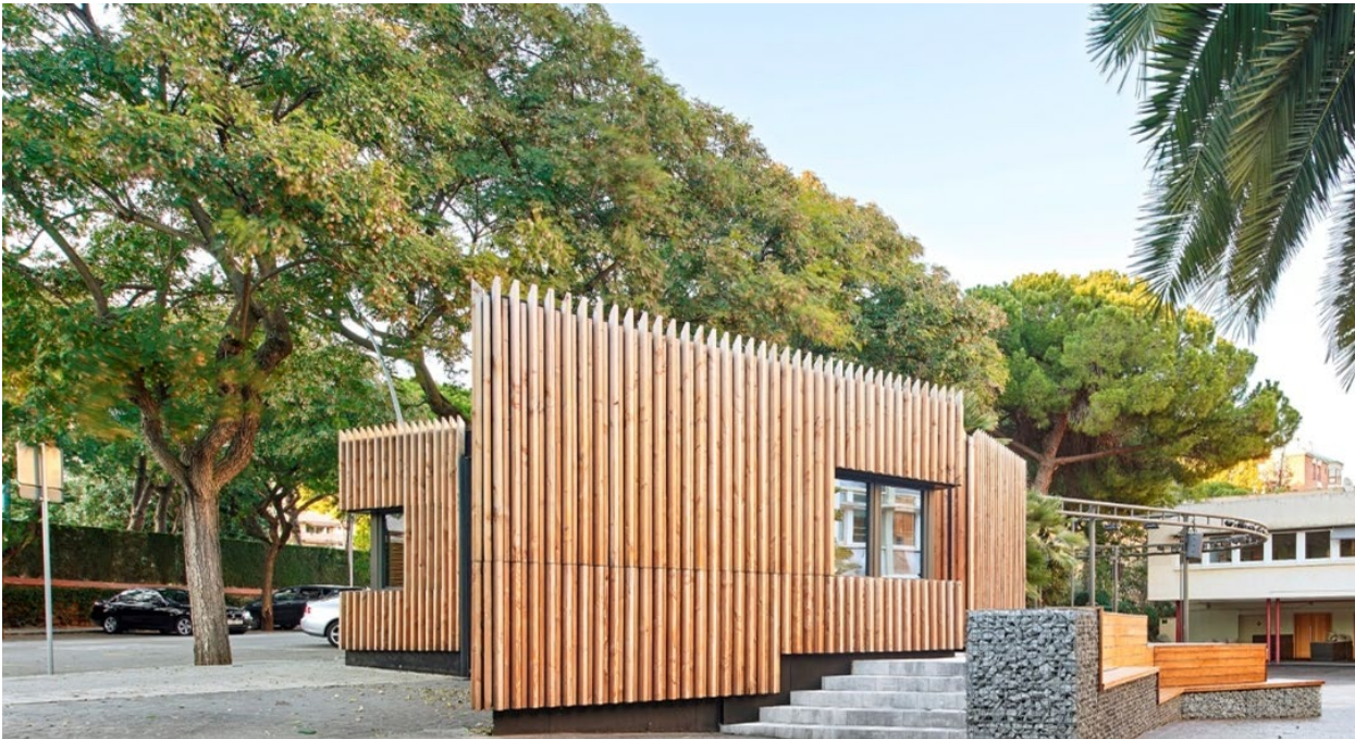
Lycée Français in Barcelona, arh. COMA Arquitectura, Barcelona, 2018

Copacii pot constitui bariere în calea vântului, bariere fonica față de traficul auto, purifică aerul și crează un ambient plăcut în preajma clădirilor.